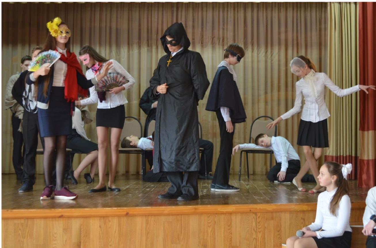
8М класс представляет сцены из спектакля «Ромео и Джульетта» английского драматурга Уильяма Шекспира в традициях уличного спектакля 16-17 веков